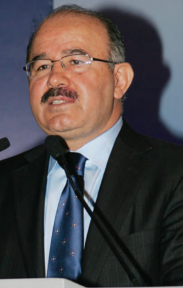
Hüseyin ÇELİK AKP Genel Bşk. Yrd.