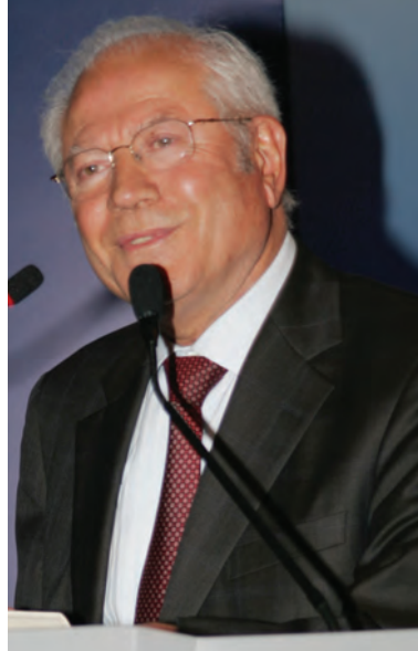
Mustafa ÖZYÜREK TÜRMOB Onursal Bşk./CHP Milletvekili