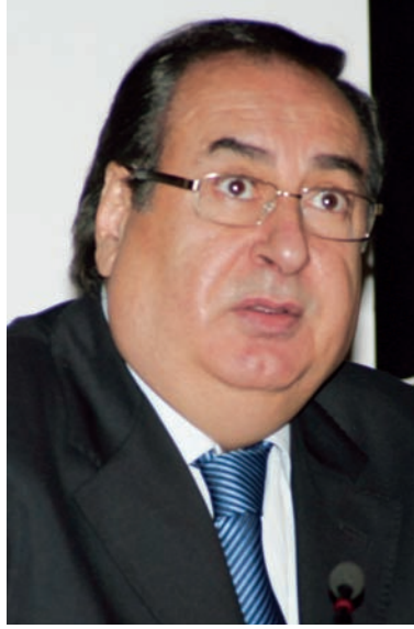
Macit ÖZCAN Mersin Büyükşehir Belediye Bşk.

dışında başka kesimlerle birlikte bir araya getirilmesidir. Zaten şikâyetçi olduğumuz ve külfet, yük getiren birçok düzenleme meslek mensuplarıyla birlikte kararlaştırılmadığı için bugün karşımıza çıkmaktadır. Ama bu krizin son günlerde en büyük ve bütün arkadaşlarımızın uykularını kaçırarak tarafı BA-BS beyanlarıyla ilgilidir. Bu konuda ciddi bir eğitim gerçekleşmediği, BA ve BS'lerin denetimde nasıl kullanılacakları açıklanmadığı ve bu konuda en önemlisi, iş adamlarımızın bile bu konuda bilgilendirilmediği noktada ve ilk verilen beyanlardan dolayı yüksek derecede vergi cezalarıyla karşı karşıya kalınmaktadır. Bu konuda müşterek bir çözüm hem işadamlarımızı hem de işadamlarımız adına düşünen, onların dertlerini yükümlenen değerli meslektaşlarımızı rahatlatacaktır. Bütün meslektaşlarımızın en büyük beklentisi BA-BS'nin ilk uygulamasında ortaya çıkan bazı eksikliklerin giderilme-