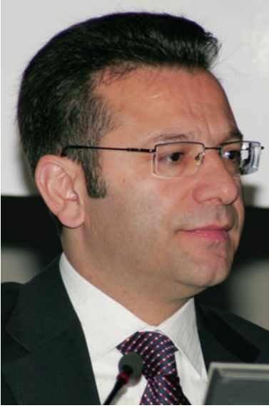
Hüseyin AKSOY Mersin Valisi

dışında başka kesimlerle birlikte bir araya getirilmesidir. Zaten şikâyetçi olduğumuz ve külfet, yük getiren birçok düzenleme meslek mensuplarıyla birlikte kararlaştırılmadığı için bugün karşımıza çıkmaktadır. Ama bu krizin son günlerde en büyük ve bütün arkadaşlarımızın uykularını kaçırarak tarafı BA-BS beyanlarıyla ilgilidir. Bu konuda ciddi bir eğitim gerçekleşmediği, BA ve BS'lerin denetimde nasıl kullanılacakları açıklanmadığı ve bu konuda en önemlisi, iş adamlarımızın bile bu konuda bilgilendirilmediği noktada ve ilk verilen beyanlardan dolayı yüksek derecede vergi cezalarıyla karşı karşıya kalınmaktadır. Bu konuda müşterek bir çözüm hem işadamlarımızı hem de işadamlarımız adına düşünen, onların dertlerini yükümlenen değerli meslektaşlarımızı rahatlatacaktır. Bütün meslektaşlarımızın en büyük beklentisi BA-BS'nin ilk uygulamasında ortaya çıkan bazı eksikliklerin giderilme-