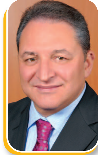
Nail SANLI TÜRMOB Genel Başkanı

TÜRHAİK'ı başarılı çalışmalarından dolayı kutlar, haksız rekabetin önlenmesinde bu çalışmanın faydalı olmasını diler, saygılar sunarım.