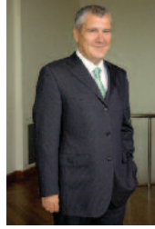
Yahya ARIKAN TÜRHAKE Başkanı